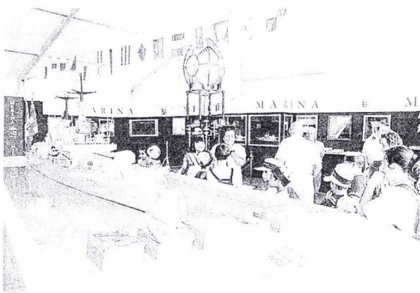
«VETRINA» Grande interesse dei baby-visitatori per i mezzi e i modelli esposti alla mostra della Marina

CSSN LABORATORIO DI ELETTROACUSTICA PER GLI STUDENTI. TUTTI TIMONIERI CON IL LITAV